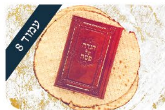
ערכים מאחורי הקלעים את פתח לו