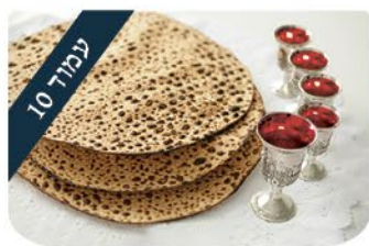
ערכים מרצי לשנת של גאולה