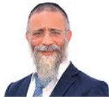
הרב מיכאל לסרי