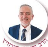
הרב ישעיה הורוויץ

השפעת גאולתן של ישראל, בלי שום ספק הביאו בשורות רבות לעולם. אפשר לסכם אותן במילה אחת-גאולה... לעולם כולו.