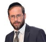
הרב משה לנדא