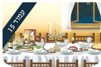
ערכים לילדים הגדת

טועה מי שחושב שעבדות היא שרשראות וחומות ברזל. העבדות האמיתית נמצאת, בתוך הראש