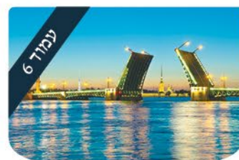
ערכים הניצוץ היהודי ארכה הדרך לחירות