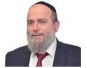
הרב דניאל נשיא