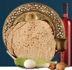
העלון טעון גניזה