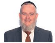
הרב דוד ברוורמן

כאשר נפרד הרבי ר' יחזקאל מקוֹזְמיר ז"ע מידידו, רבי ר' שמחה בונים מפְּשִׁיֶסְקָא ז"ע, ליווה אותו רבי שמחה בונים כבֶּרֶת דרך אל מחוץ לעיר. בדרך הילוכם רצה רבי יחזקאל לשמח את לב ידידו רבי שמחה בונים, הוציא הוא את קופסת הטבק שנשא עמו, ונתן לו כדי שיריח מהטבק.