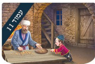
ערכים לילדים לקראת שבת

הברנש הסעודי נהג לשלם במעטפות כסף, תמיד במזומן ותמיד בזמן.