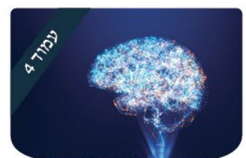
הרב דניאל נשיא הפסיכולוגיה-מדע או השקפת עלים?