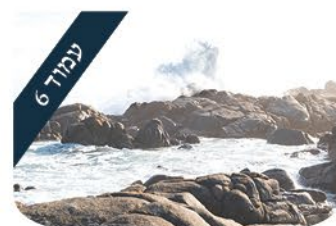
הניצוץ היהודי הנאה מסוג אחר