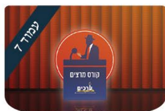
ערכים מאחורי הקלעים ללמוד מהמובילים, להיות מובילים!